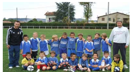
Les débutants à l'entraînement à St-Martory, Le samedi après-midi