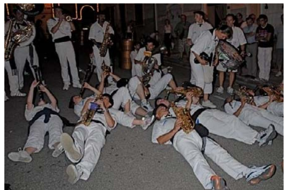
RENVERSANT NON ?